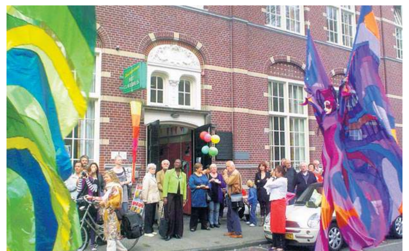
Het Claverhuis op de DAG van de Buurt 2009

zen terwijl de kantoren van Centram naar Straat&Dijk in de Haarlemmerstraat vertrekken. In verband met de ver van het Claverhuis afgelegen Westelijke Eilanden, Westerdokseiland, Haarlemmerbuurt en Noord-Jordaan, wordt getracht nog buurtgerichte activiteiten in Straat&Dijk overeind te houden.