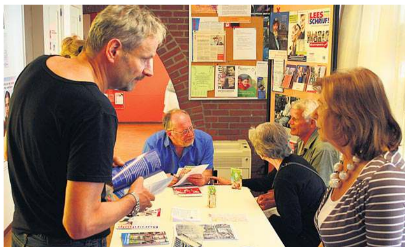
In de Laurierhof presenteerden zich meerder vrijwilligersorganisaties