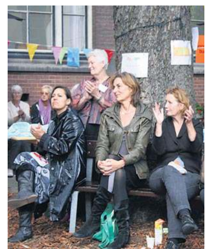
DAG van de Buurt 2010