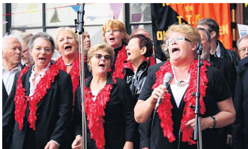
Puur Mokum in actie

door de buurtzangkoren DWARSdoorAMSTERDAM en PUUR